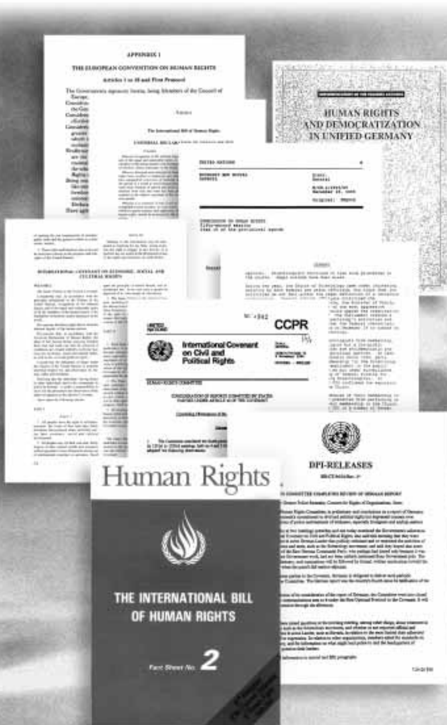
Het Internationale Verdrag van Burgerlijke en Politieke Rechten van de Verenigde Naties en andere verdragen op het terrein van de mensenrechten beschermen en garanderen vrijheid van denken, geweten en godsdienst in alle 137 landen die het verdrag hebben ondertekend.