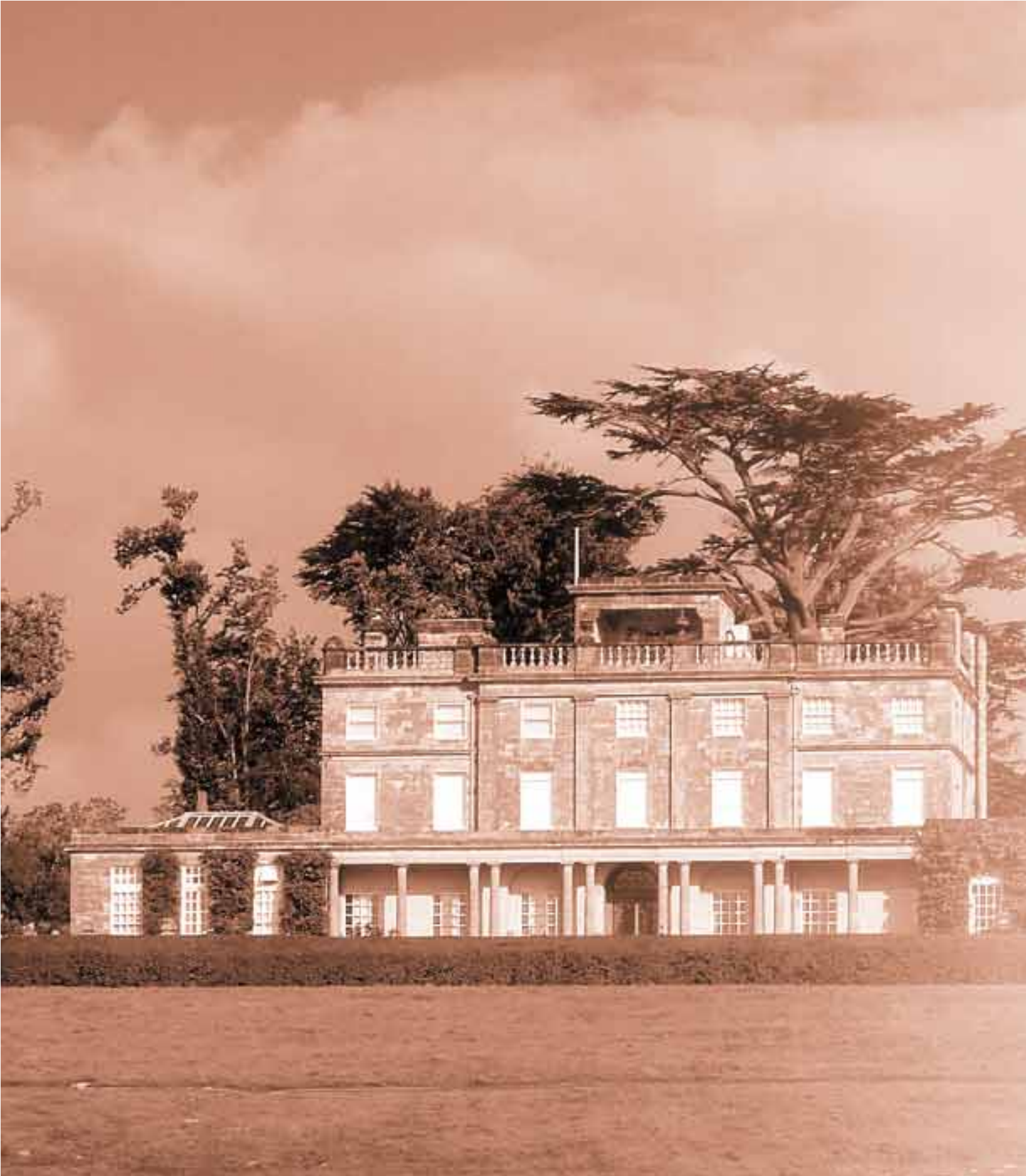
L. Ron Hubbard woonde van 1959 tot 1966 in Saint Hill Manor, in het Engelse graafschap Sussex. Saint Hill doet ook dienst als internationaal opleidingscentrum en is één van de hoofdzetels van de Scientology kerk.